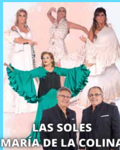
LAS SOLES MARÍA DE LA COLINA SALMARINA