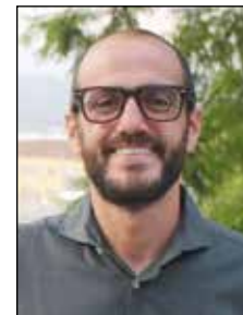
Andrés García Concejal-Delegado de Fiestas, Turismo y Cultura